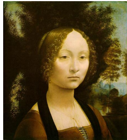
女子肖像 (1474-1476 年)